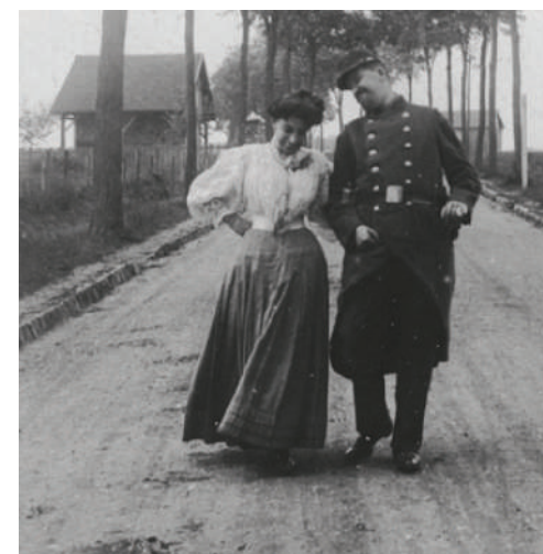
Photo extraite du film Centenaire de la Retraite Mutualiste du Combattant.