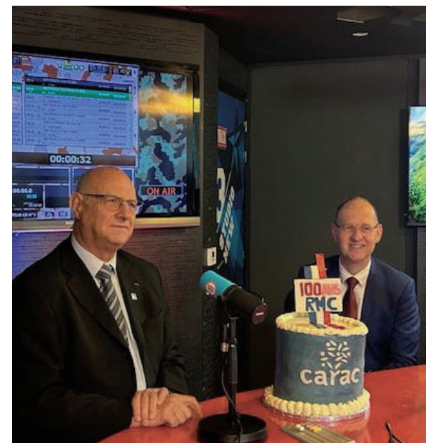
Émission spéciale 100 ans de la RMC.