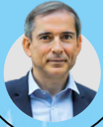
DOMINIQUE LJBALUT Directeur de l'École nationale Supérieure de Sécurité Sociale (EN3S)